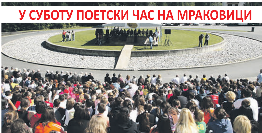
У СУБОТУ ПОЕТСКИ ЧАС НА МРАКОВИЦИ