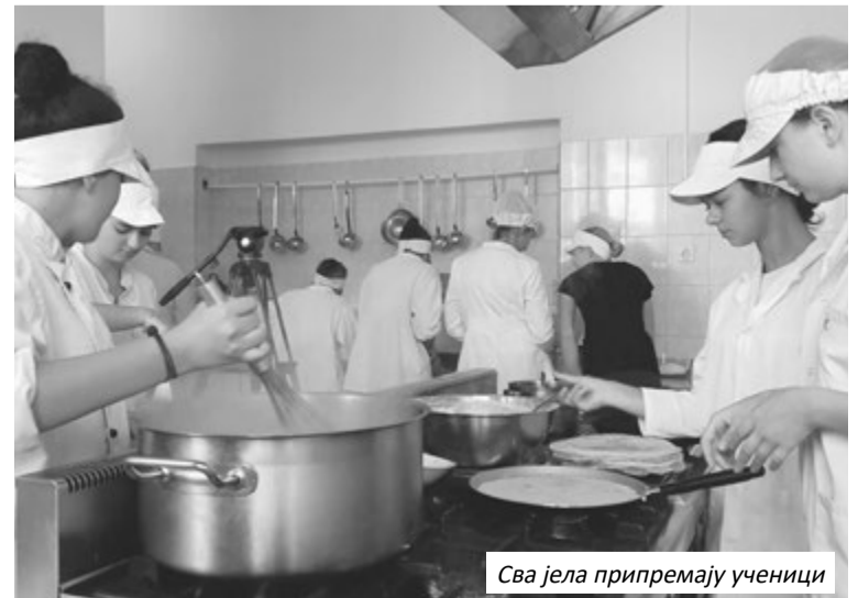
Сва јела припремају ученици