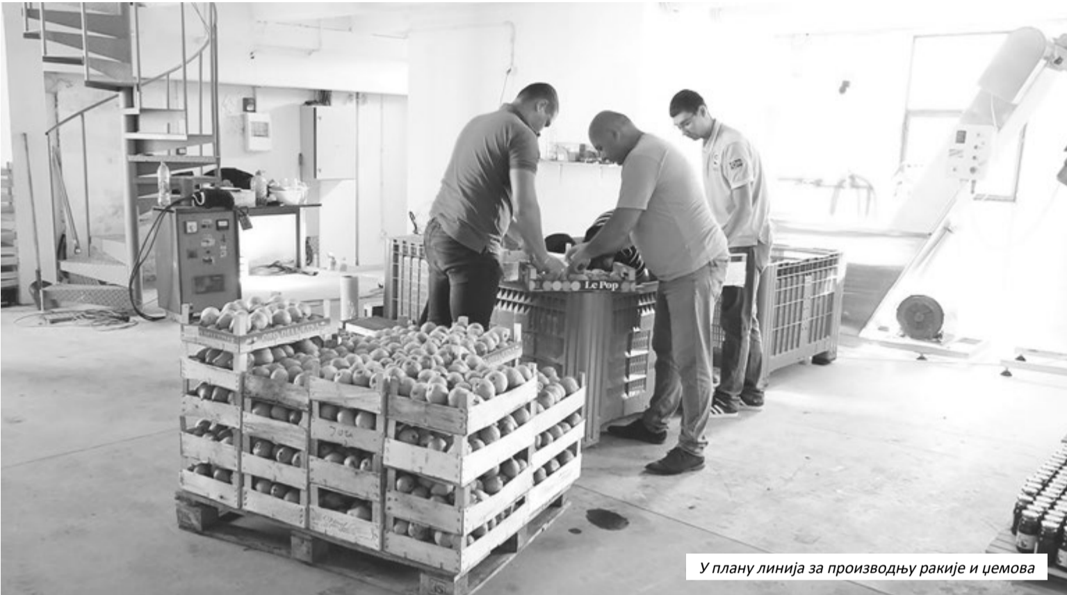
У плану линија за производњу ракије и џемова