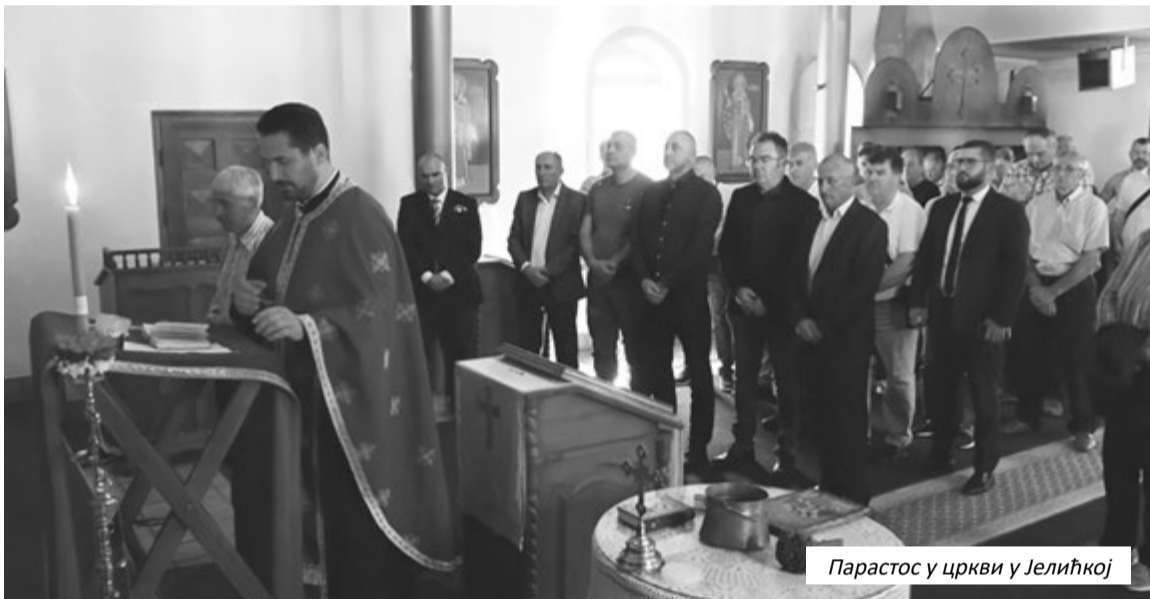
Парастос у цркви у Јелићкој

Поводом Дана ратних војних инвалида, у цркви у Јелићкој служен је парастос погинулим и умрлим ратним војним инвалидима. Из рата је изашло око 45.000 ратних војних инвалида, а сада их има 29.520.