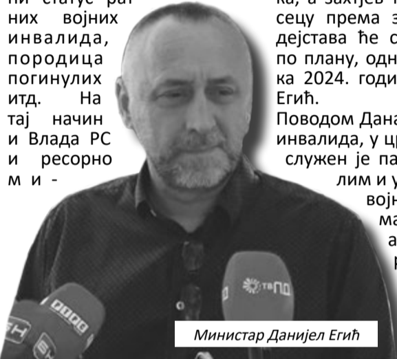
Министар Данијел Егић