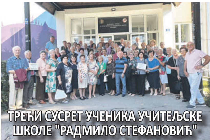
ТРЕЋИ СУСРЕТ УЧЕНИКА УЧИТЕЉСКЕ ШКОЛЕ "РАДМИЛО СТЕФАНОВИЋ"