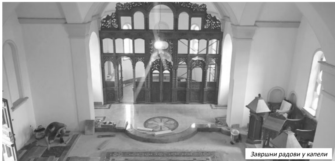
Завршни радови у капели

“Манастир је озидан, покривен, постављени су прозори. Унутра је све набачено, урађено је подно гријање и клазура. Сада смо стопирали радове у манастиру. Базирали смо се на манастирски конак, чија је изградња трајала упорно са манастиром. Манастирски конак је такође озидан и покривен, сада се изводе радови у унутрашњости конака и капеле који су при крају, а затим слиједи опремање конака и капеле, да може неко да се усели и отпочне монашки живот у овом манастиру”, истакао