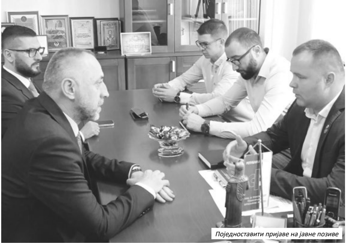
Поједноставити пријаве на јавне позиве