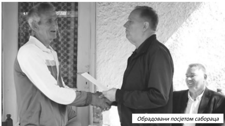
Обрадовани посјетом сабораца

“У Борачкој организацији Приједора имамо око 2.200 бораца инвалида. Већина њих су преко 4.