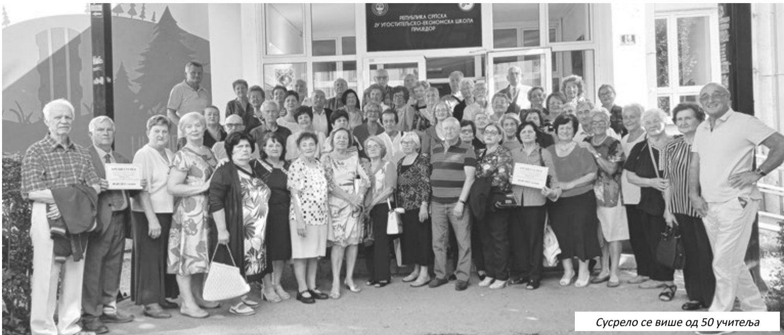
Сусрело се више од 50 учитеља