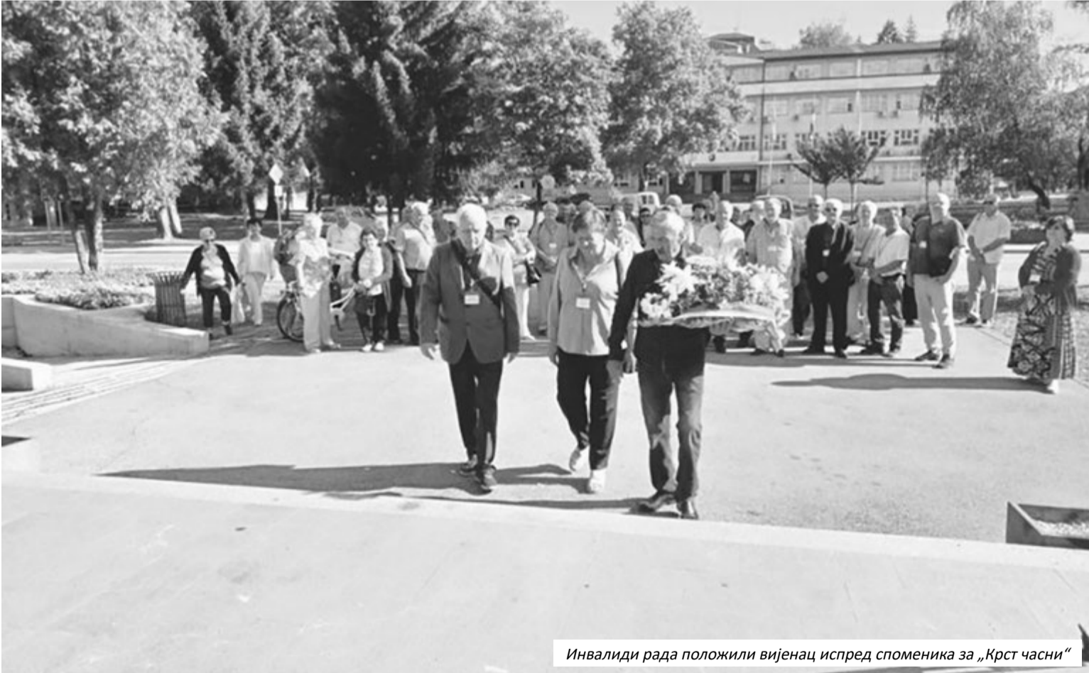
Инвалиди рада положили вијенац испред споменика за „Крст часни“