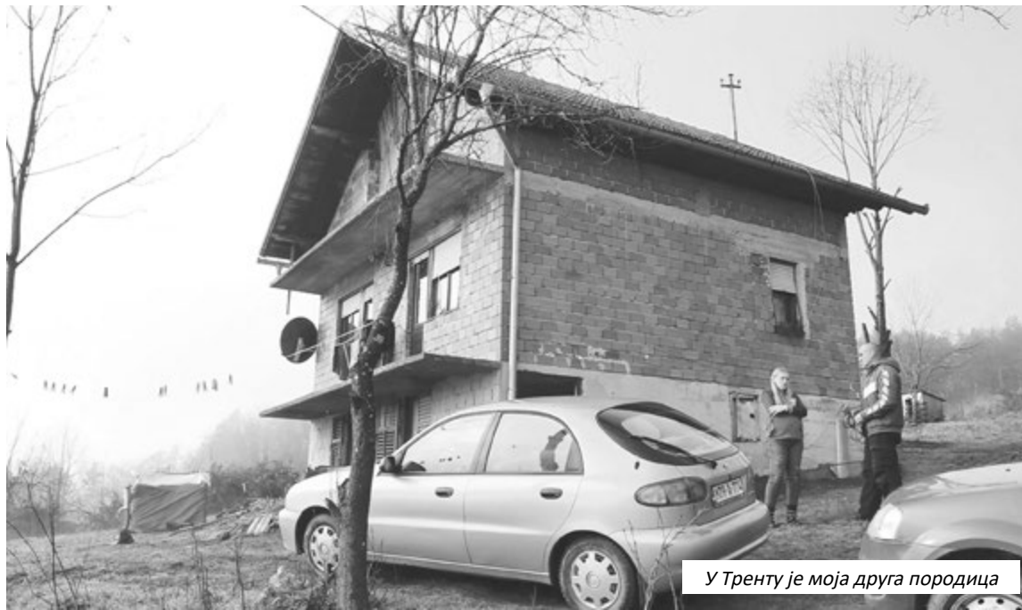
У Тренту је моја друга породица

стотине италијанских породица помагало је исто толико наших породица. Корона је, нажалост, то промијенила. “Многе породице након ковида су се нашле у тешкој финансијској ситуацији, тако да су одустале од подршке. Сада имамо неких стотињак породица са тенденцијом смањења. Нажалост, имамо пуно људи на подручју града Приједора у стању социјалне потребе, међутим немамо