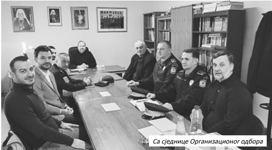
Са сједнице Организационог одбора