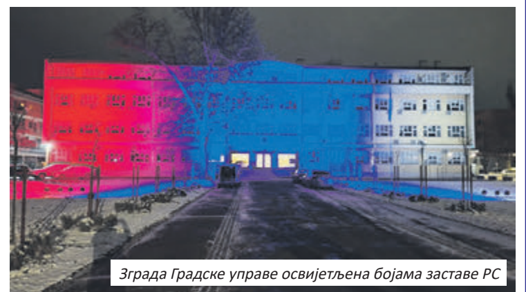
Зграда Градске управе освијетљена бојама заставе РС

"То указује само једно, да Република Српска има будућност, што нам је јако битно. Важно је да будемо сви заједно и сложни, јер само