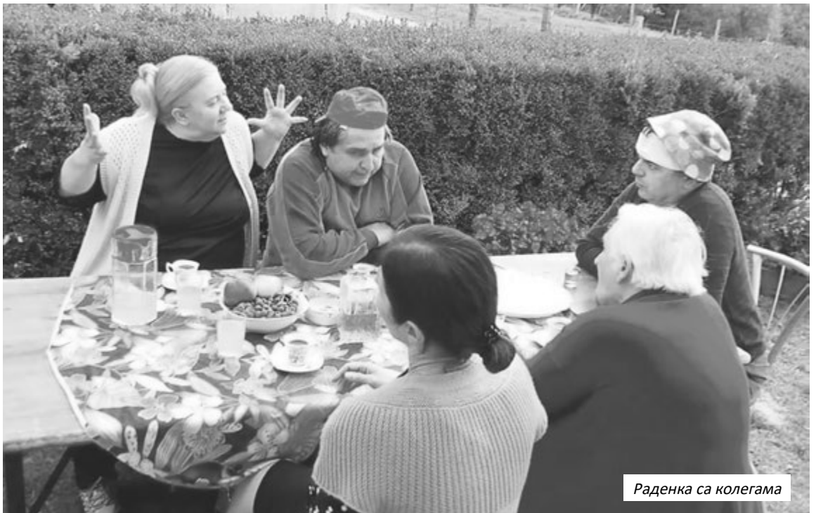
Раденка са колегама

"У почетку нам је била сиромашна продукција, радили смо уз помоћ штапа и канапа, али са много љубави и изината да покажемо да имамо