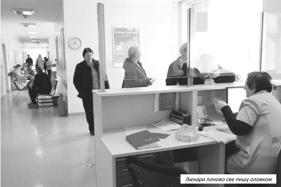
Льекари поново све пишу оловком

веног осигурања РС добили инструкције о начину рада након хакерског напада. "Пад система је узроковао више проблема, али највише су погођени грађани и пацијенти. Тешко је свима, вјерујте, али нико нема чаробни