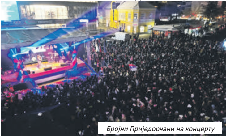
Бројни Приједорчани на концерту

градоначелник Приједора. У част Дана Републике, у Приједору је приређен велики ватромет, а зграда Градске управе била је освијетљена бојама заставе Републике Српске.