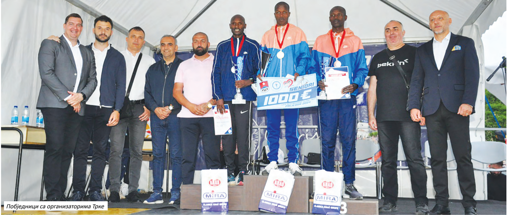
Побједници са организаторима Трке