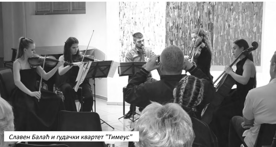
Славен Балаћ и гудачки квартет "Тимеус"