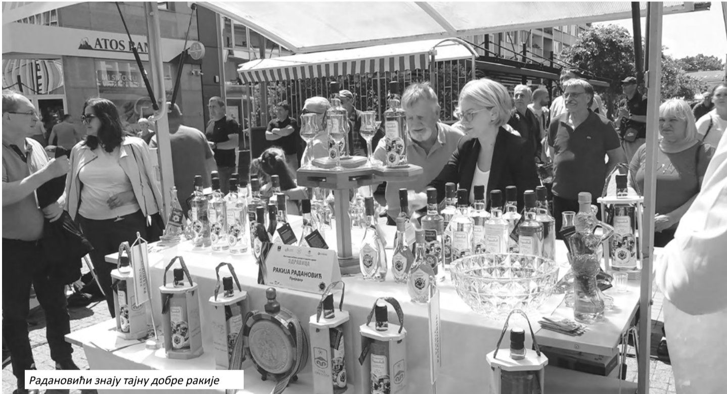
Радановићи знају тајну добре ракије