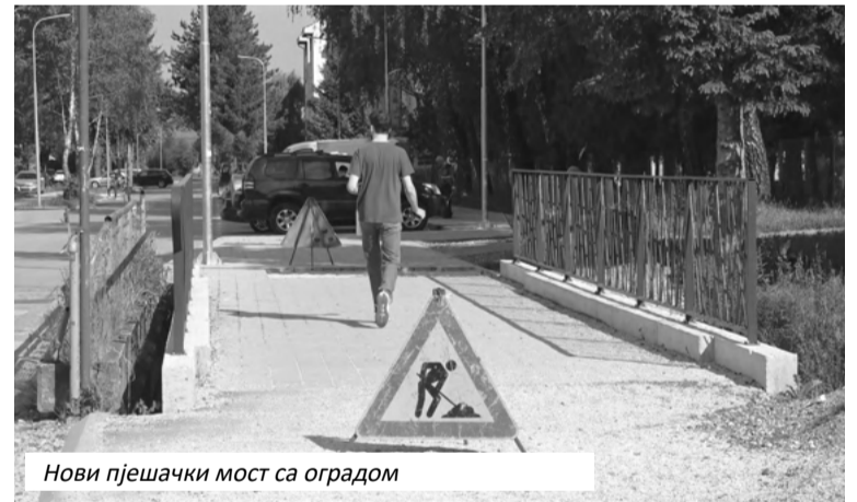
Нови пјешачки мост са оградом