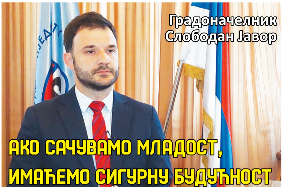
Градоначелник Слободан Јавор

АКО САЧУВАМО МЛАДОСТ, ИМАЋЕМО СИГУРНУ БУДУЋНОСТ