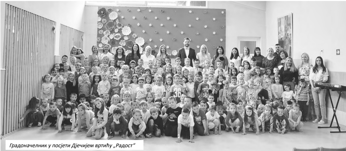
Градоначелник у посјети Дјечијем вртићу „Радост“

гулација корита ријеке Милошевице, у шта је уложено око 3.600.000 КМ. Регулација корита је ријешила дугогодишње проблеме наших суграђана. Резултат тога је да задње велике кише нису заплавиле овај дио нашег града. Ускоро нас очекује асфалтирање више путних праваца, пројекат изградње канализационе мреже у Гомјеници и Омарској у износу од милион марака, изградња физкултурне сале Подручне школе „Бранко Ћопић“ у Гомјеници. Средства за салу обезбиједио је Град у износу од 350.000 КМ и 300.000 КМ од предсједника РС Милорада Додика. Што се завршетка дворане на Уријама тиче, имамо договор и обећање предсједника Србије Александра Вучића да ћемо добити средства од 1.500.000 евра за њен завршетак. Средства за дворану очекујемо у току ове године. Оно што сигурно сви жељно ишчекујемо је реконструкција Болнице "Др Младен Стојановић". На том пројекту ради се нешто више од годину дана. Није га лако направити. Огроман је то подухват. Битно је напоменути да ће реконструкција Болнице бити повјерена локалним фирмама и Заводу за изградњу града. Очекујемо да ћемо кроз мјесец дана добити дуго очекивано идејно рјешење реконструкције ове здравствене установе. Остаје да Министарство да позитивно мишљење и да Влада Српске усвоји приједлог и план реконструкције, након чега ћемо расписати тендер. Полагање камена темељца ће бити у овој години.