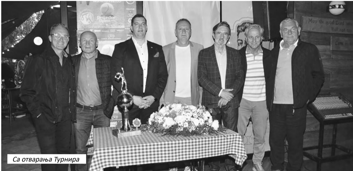
Са отварања Турнира