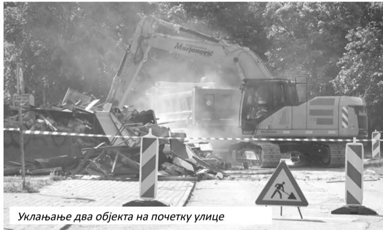
Уклањање два објекта на почетку улице

„Уклањањем ових објеката биће олакшан улаз у насеље Пењани и неће бити гужве. То је оно што су од нас тражи-