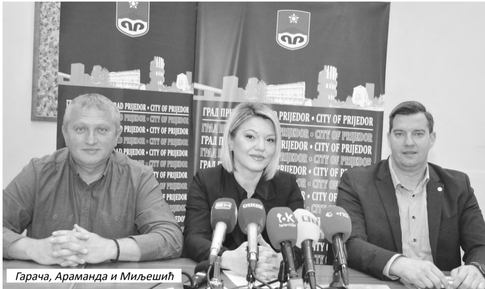
Гарача, Араманда и Миљешић

Вршилац дужности директора Туристичке организације града Приједора