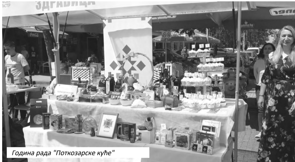
Година рада "Поткозарске куће"

"Част нам је и задовољство што имамо велики број излагача на Малом градском тргу. Надам се да ће ова прелијепа манифестација да прерасте у традицију. Повод за њено ор-