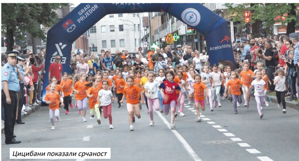
Цицибани показали срчаност

Као и претходних година, највише пажње изазвала је трка цицибана. Најмлађи учесници такмичили су се на сто метара и показали велики ниво жеље и борбености. Публика их је наградила великим аплаузом.