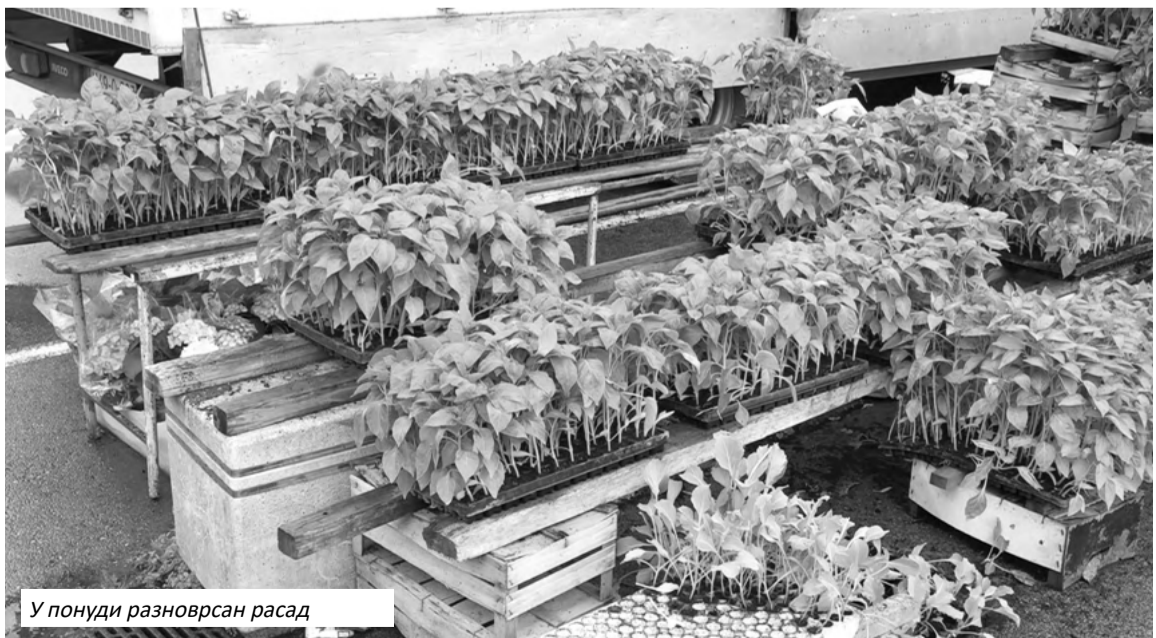
У понуди разноврсан расад

Цијене расада поврћа сличне су прошлогодишњим. Парадајз, паприка и патлиџан су по једну марку, лубеница и краставац по марку и по, а гајба паприка 20 марака.