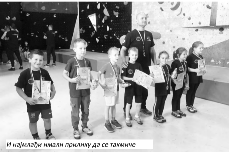
И најмлађи имали прилику да се такмиче