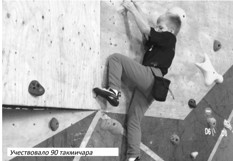
Учествовало 90 такмичара

Организатор такмичења био је Пењачки клуб "Адреналин", Приједор, у сурорганизацији са Планинарским клубом "Албатрос", а одржано је у оквиру манифестација посвећених Дану града Приједора.