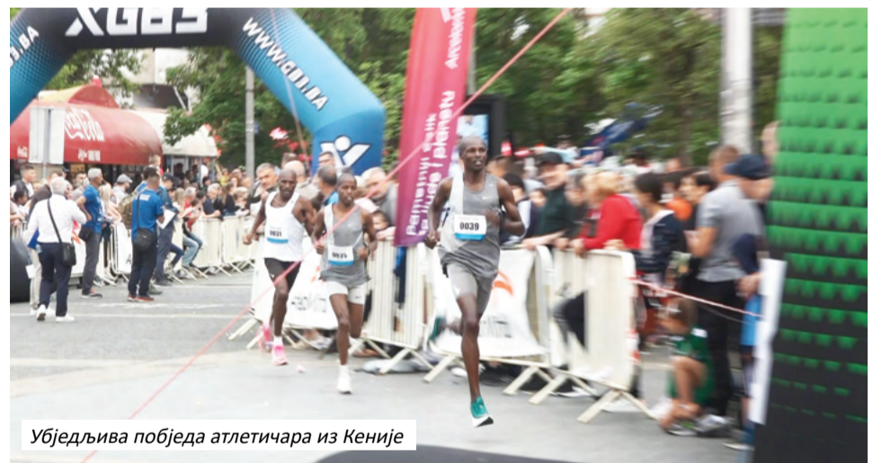
Убједљива побједа атлетичара из Кеније

"Ово је манифестација која подржава и промовише спорт и здрав начин живота. Спорт је јако важан за нашу