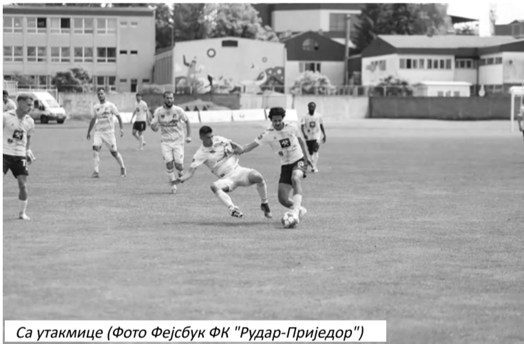
Са утакмице