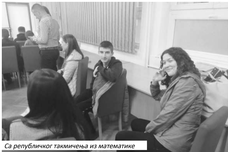
Са републичког такмичења из математике