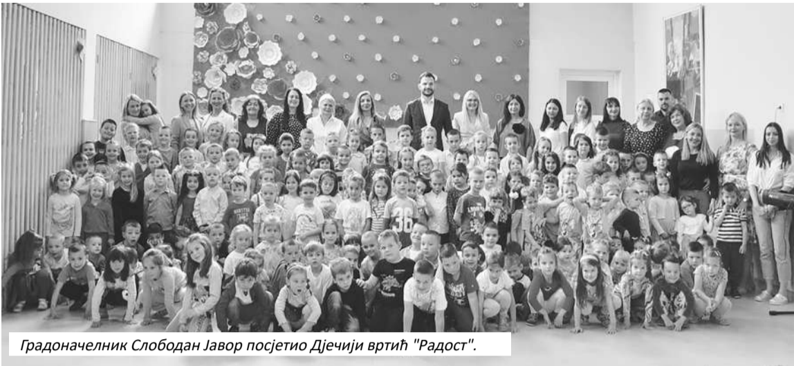
Градоначелник Слободан Јавор посетио Дјечији вртић "Радост".