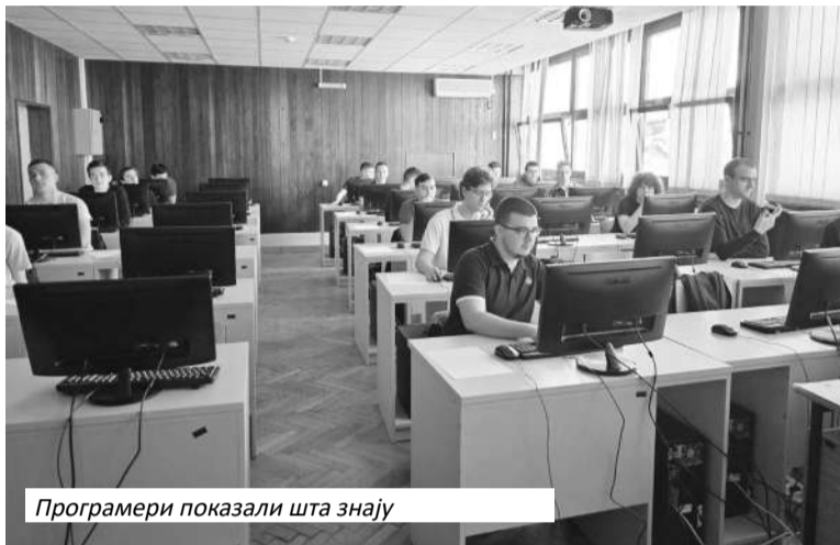
Програмери показали шта знају

Електротехничку школу Приједор похађа 429 ученика.