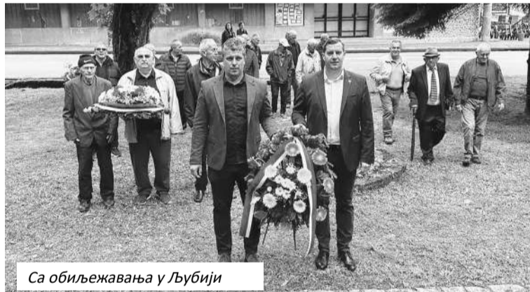
Са обиљежавања у Љубији