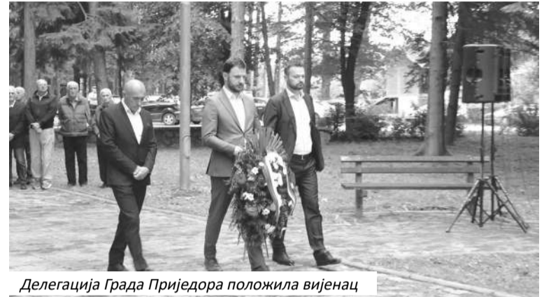
Делегација Града Приједора положила вијенац