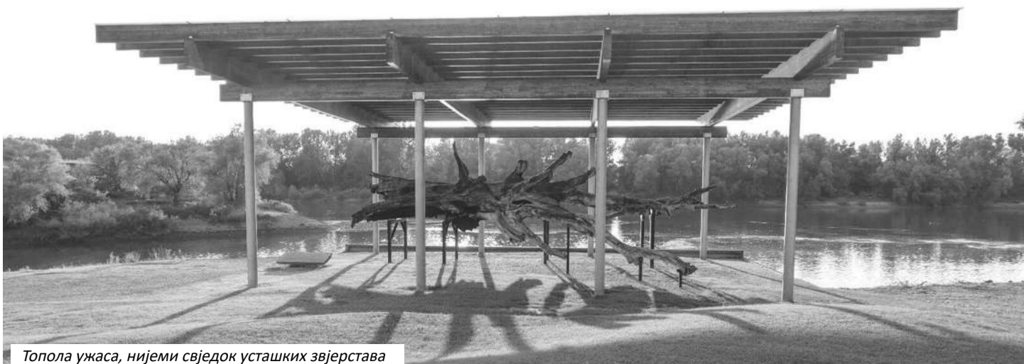
Топола ужаса, ниједи свједок усташких звјерстава