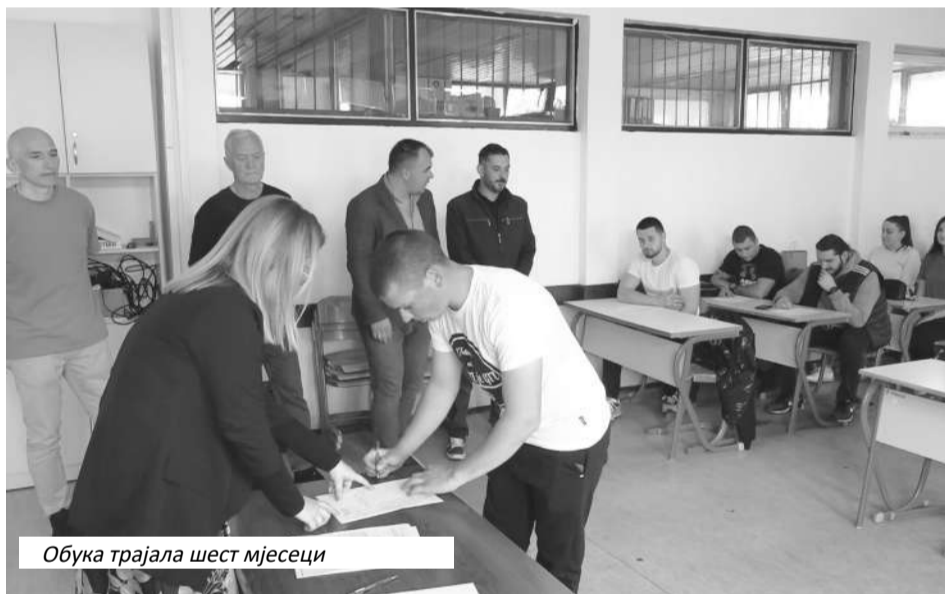
Обука трајала шест мјесеци