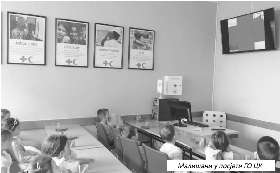
Малишани у посјети ГО ЦК