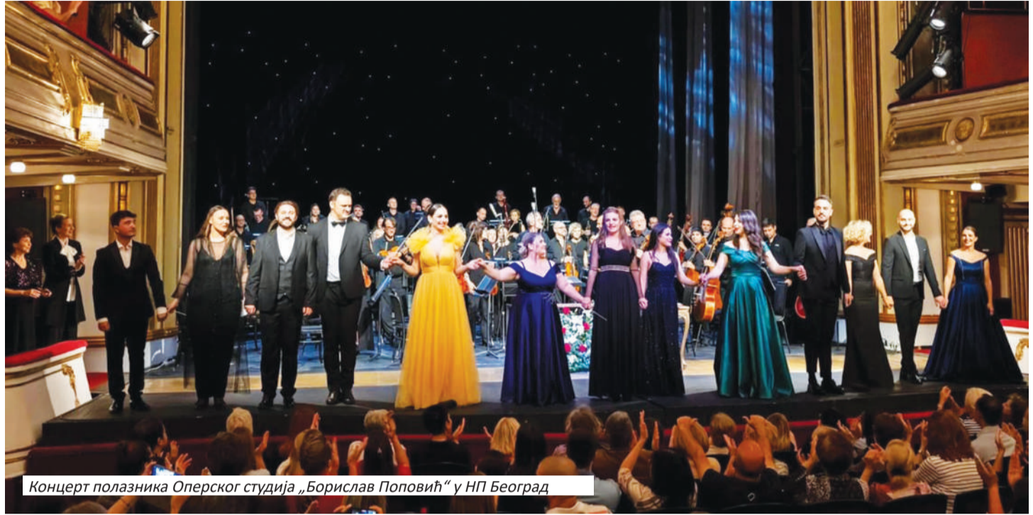
Концерт полазника Оперског студија „Борислав Поповић“ у НП Београд