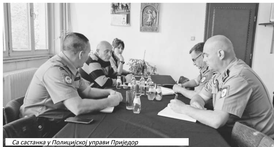
Са састанка у Полицијској управи Приједор

"У наредном периоду предузеће се све потребне мјере и радње како би се очувало стање безбједности и матурске прославе протекле без нежељених посљедица", закључују у саопштењу из ПУ Приједор.