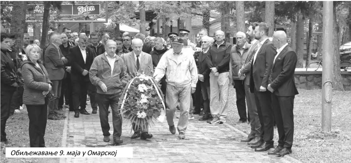
Обиљежавање 9. маја у Омарској