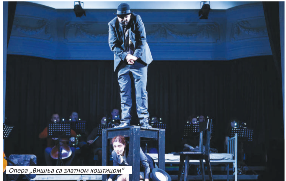
Опера „Вишња са златном коштицом“

„Прије више од 10 година, освојио сам специјалну награду на Републичком такмичењу средњих музичких школа у Бањалуци. Важно ми је ова награда, јер сам тада први пут повјеровао у свој таленат