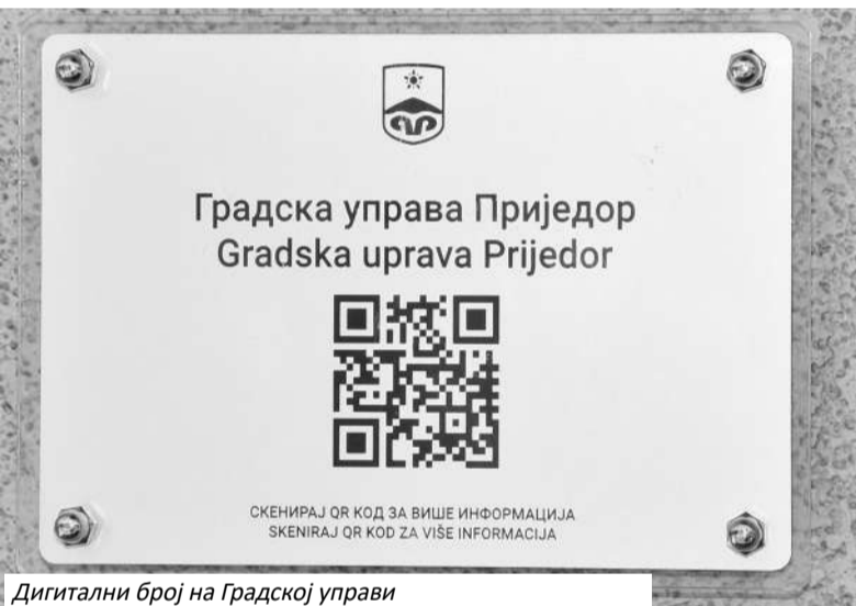
Дигитални број на Градској управи