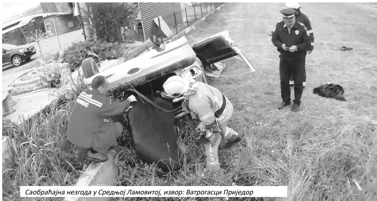
Саобраћајна незгода у Средњој Ламовитој

Из ове управе апелују на све возаче да поштују саобраћајна правила и прописе, прилагоде брзину условима и стању на коловозу и да не управљају возилом под дејством алкохола или других психоактивних супстанци.