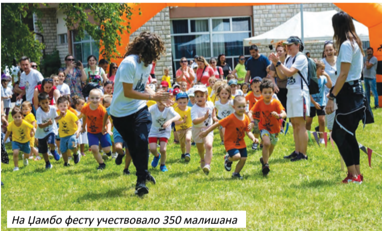
На Џамбо фесту учествовало 350 малишана

Текст: Козарски вјесник