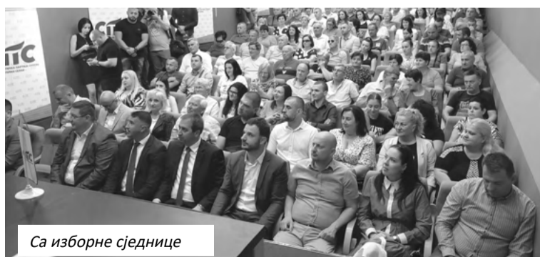
Са изборне сједнице

сваким даном придружују нови чланови. Користим прилику да позовем све вриједне људе да се прикључе СПС-у, да ствари мијењамо набоље. Простора за напредак има, али важно је да помогнемо сваком човјеку, да се појединачно бавимо проблеми-