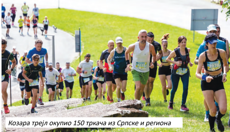
Козара трејл окупио 150 тркача из Српске и региона