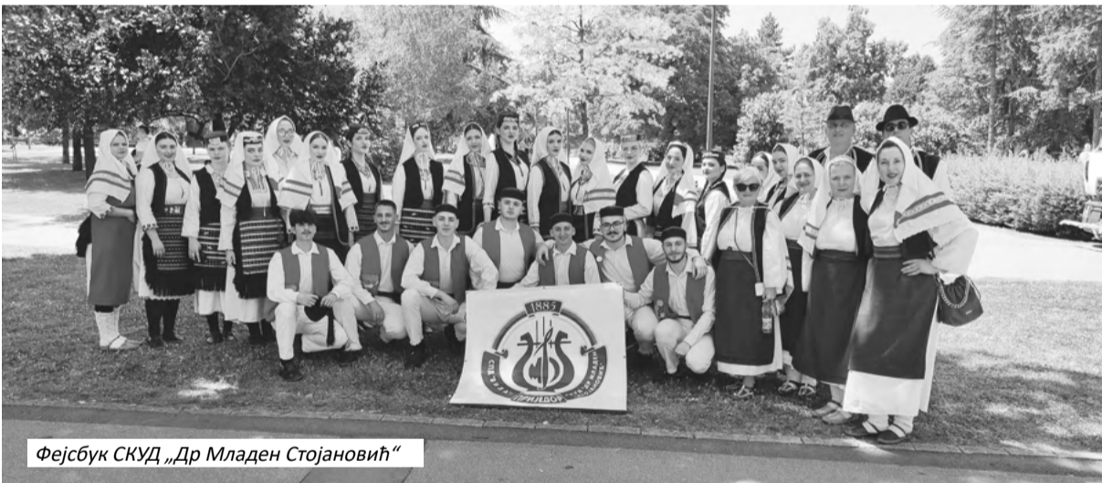
Фејсбук СКУД „Др Младен Стојановић“

У оквиру Свесрпског сабора у Београду, Национални ансамбл „Коло“, у партнерству са Савезом аматерских културно-умјетничких друштава Републике Српске, организовао је смотру фолклора, на којој су учествовала културно-умјетничка друштва Србије и Републике Српске. Међу њима и