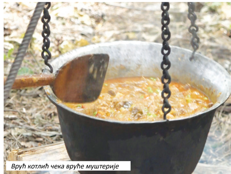
Врућ котлић чека вруће муштерије

“Свакако је ово добра прилика за промоцију туристичких потенцијала и свега онога што нуди Приједор у туристичком, ловачком и