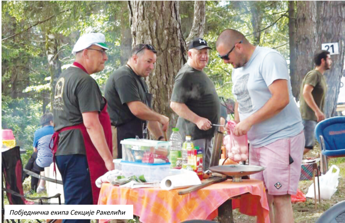
Побједничка екипа Секције Ракелићи