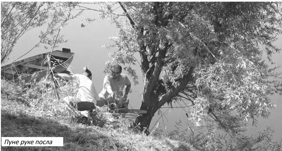
Пуне руке посла