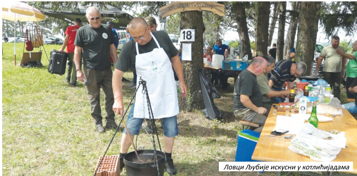
Ловци Љубије искусни у котлићијадама