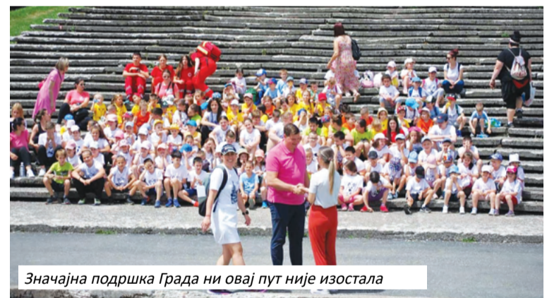
Значајна подршка Града ни овај пут није изостала