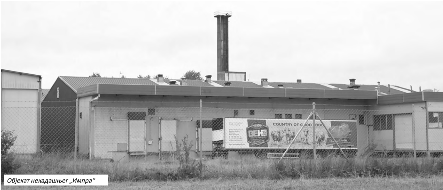
Објект некадашњег „Импра“