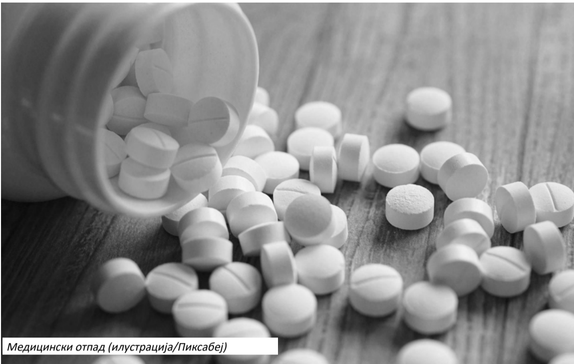
Медицински отпад (илустрација/Пиксабеј)