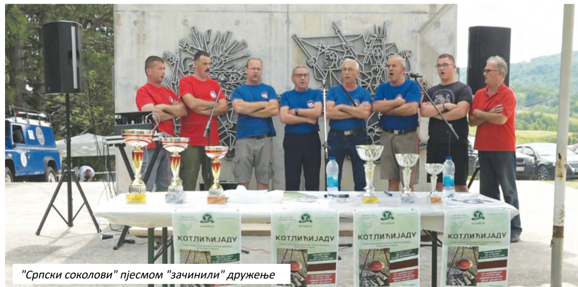
“Српски соколови” пјесмом “зачинили” дружење