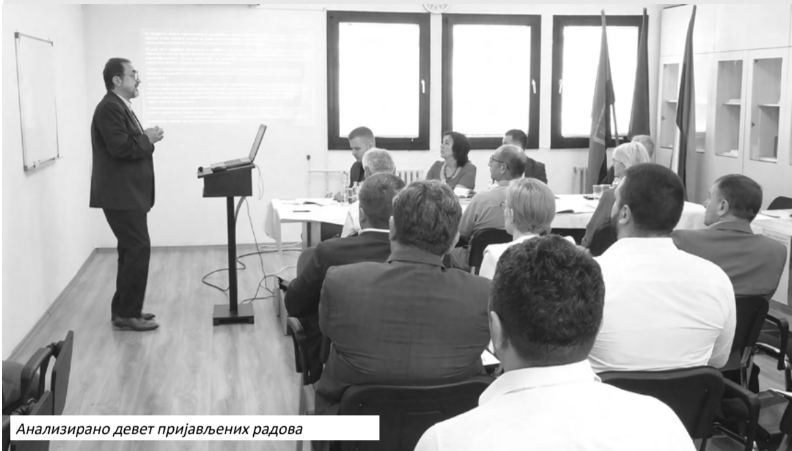
Анализирано девет пријављених радова