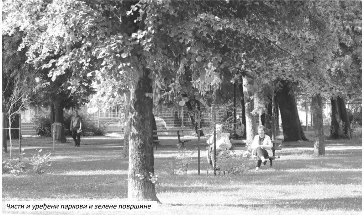
Чисти и уређени паркови и зелене површине