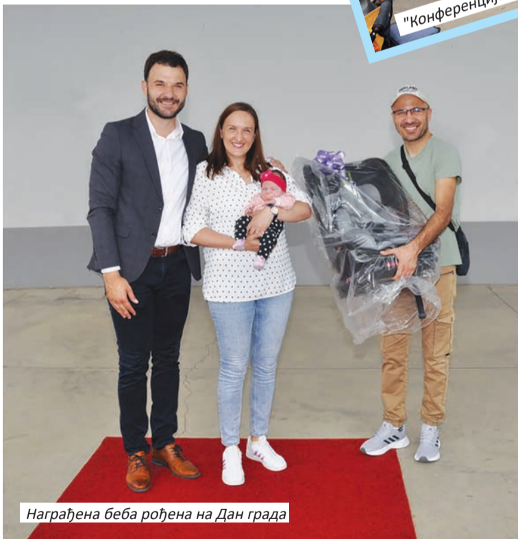
Награђена беба рођена на Дан града