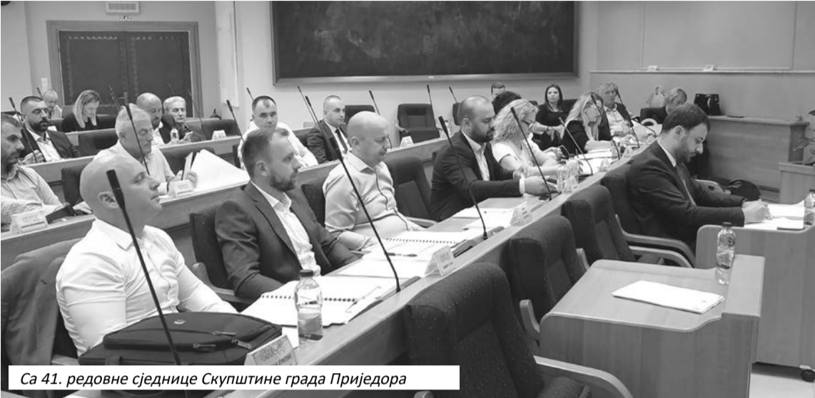
Са 41. редовне сједнице Скупштине града Приједора