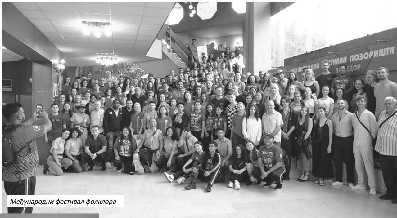
Међународни фестивал фолклора