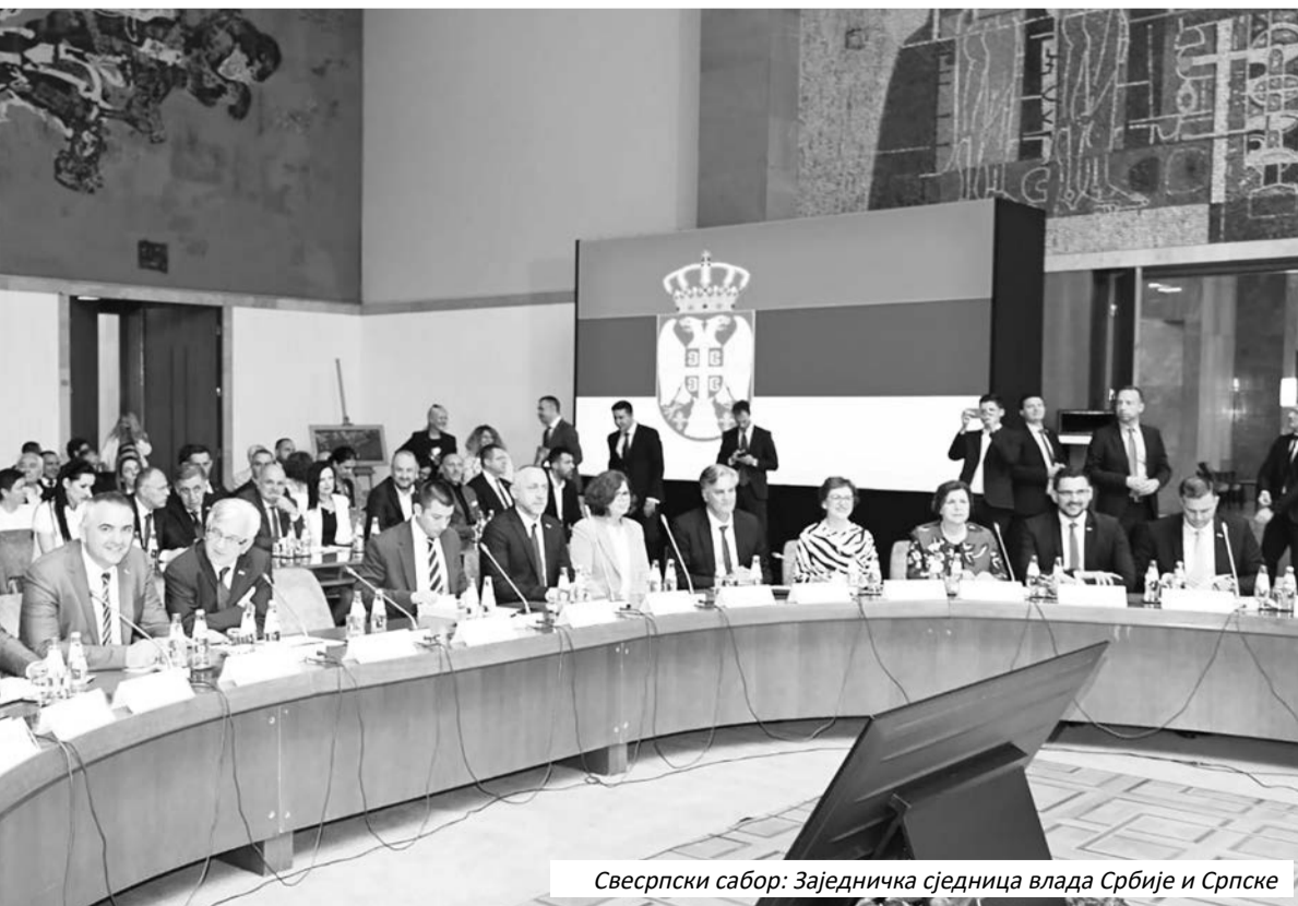
Свесрпски сабор: Заједничка сједница влада Србије и Српске

Скупштина српског народа у БиХ на засједану у Бањалуци, 12. маја 1992. године, донијела је одлуку о формирању Војске РС. Постојала је од 12.5. 1992. до 1.1.2006. године, након чега је ушла у састав Оружаних снага БиХ. Кроз Војску РС прошло је 210.000 бораца, а 23.801 њен припадник положио је живот у Одбрамбено-отаџбинском рату за одбрану Српске.