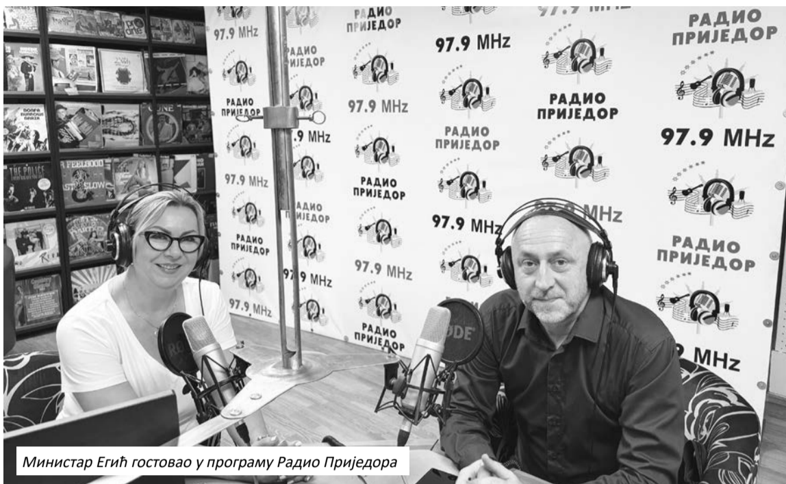
Министар Егић гостовао у програму Радио Приједора

Министарству вршимо ревизију за око 200 бораца.