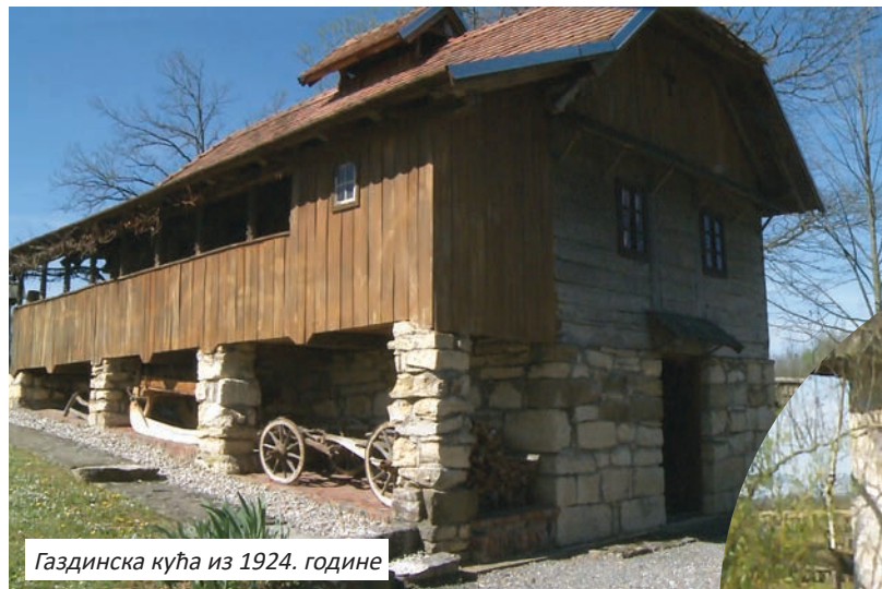
Газдинска кућа из 1924. године

предмети. Сви сачувани у изворном облику.