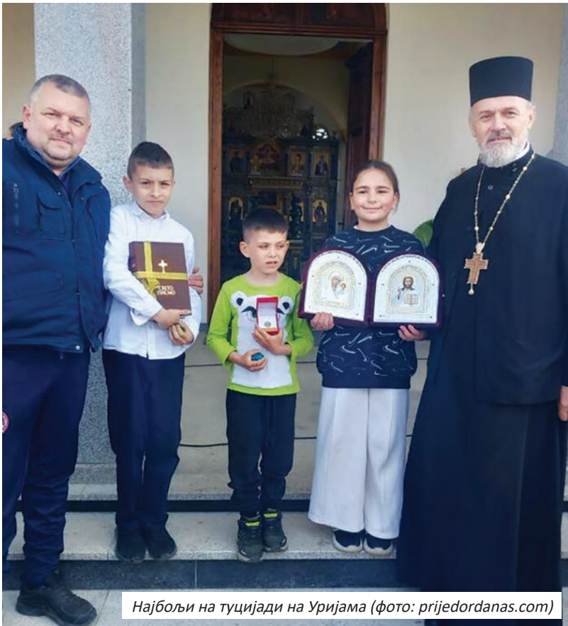
Најбољи на туцијади на Уријама