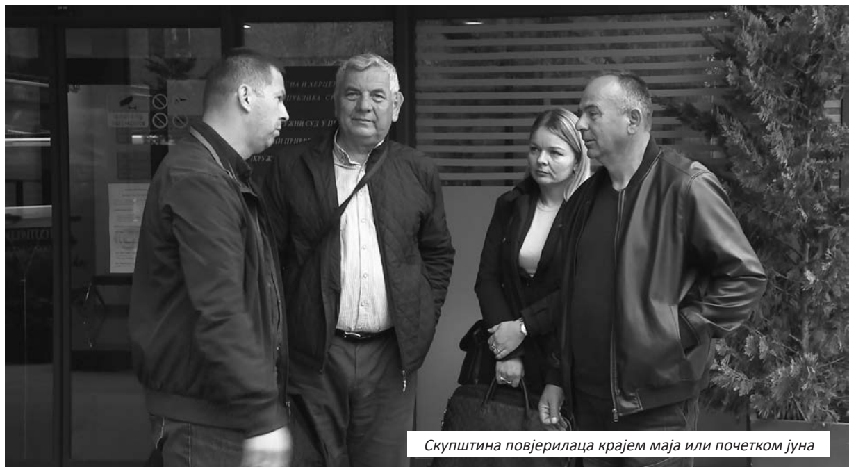
Скупштина повјерилаца крајем маја или почетком јуна

ка предвиђа пренос комплетне имовине и права на новоосновано или већ постојеће привредно друштво, о чему ће коначну одлуку донијети Град Приједор и Влада Републике Српске. Укупна имовина биће пренесена на купца за 3.827.000 КМ, чиме ће бити покривени трошкови стечајног поступка, дугови стечајне масе и призната потраживања повјерилаца. Тиме се стварају услови да рибњак настави са пословањем.