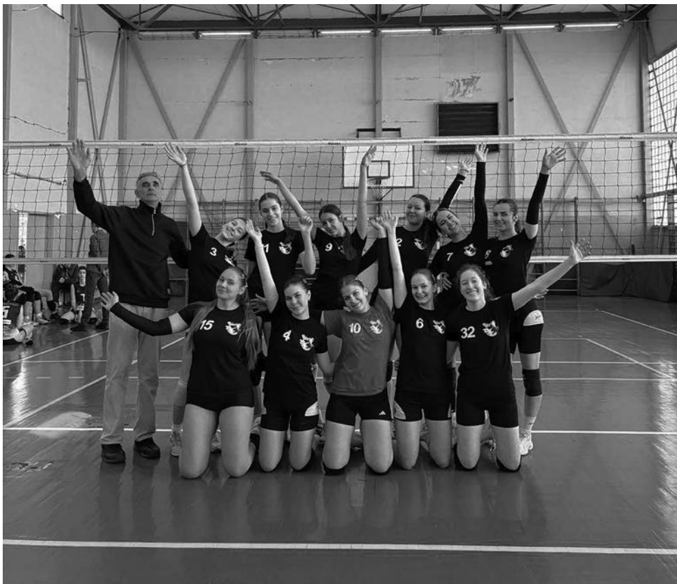
Г. Каурин

Своје активности настављају кроз традиционалне међународне турнире, за које су већ добили позиве. Дана 23. маја биће домаћини 13. међународног турнира градова под називом „Ми волимо одбојку“. Надају се добрим резултатима и на том пољу.