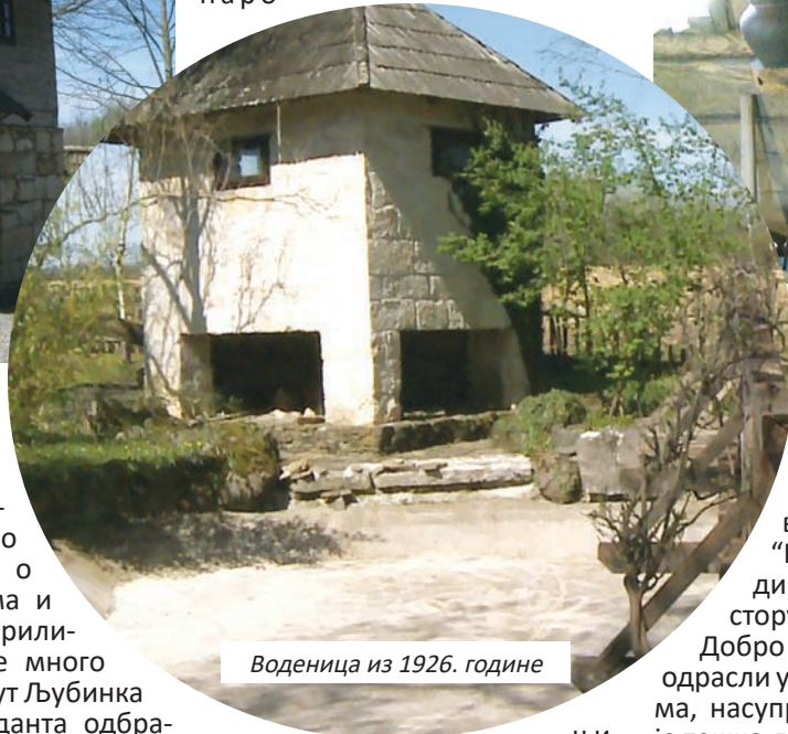
Воденица из 1926. године

димо неког препознатљивог, као што су наше комшије из Приједора, момци који снимају серију “Добро јутро, комшија”. Тако са њима имамо договор да дођу овдје барем једном годишње и да одрже нашим мјештанима, наро-