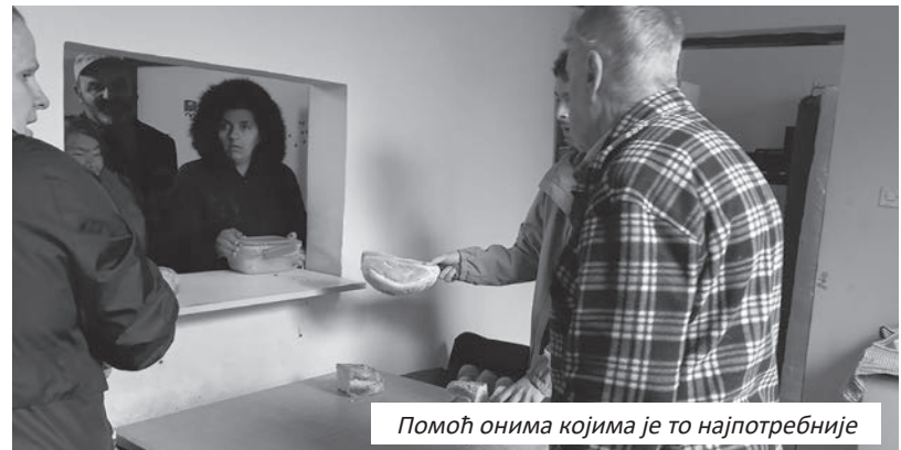
Помоћ онима којима је то најпотребније

одмарали. У сарадњи са Савјетом ученика, организована је акција којом је још једном показана хуманост и солидарност на дјелу. Ученици и радници Гимна-