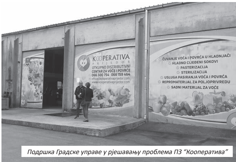
Подршка Градске управе у рјешавању проблема ПЗ “Кооператива”

У Пољопривредној задрузи окрећу се културама које су отпорне на мраз, попут боровнице, која је тражена на домаћем тржишту. “Кооператива” је основана 2017. године, а имају 11 задругара и око 120 коопераната из Приједора и сусједних општина.