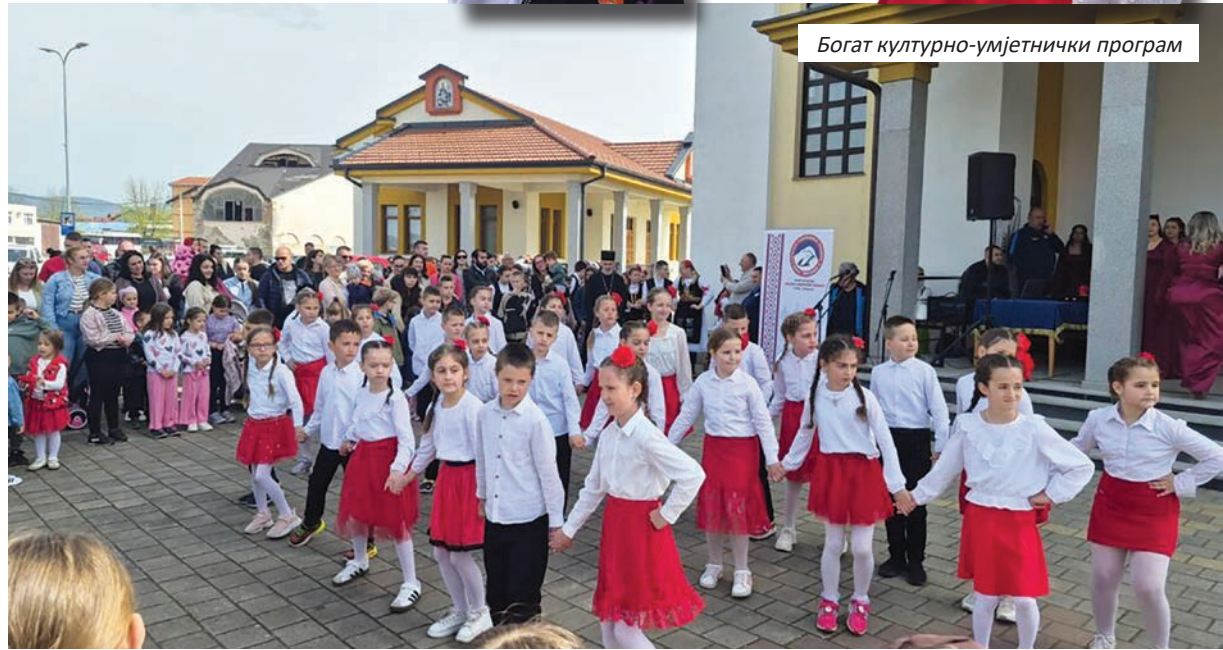
Богат културно-умјетнички програм