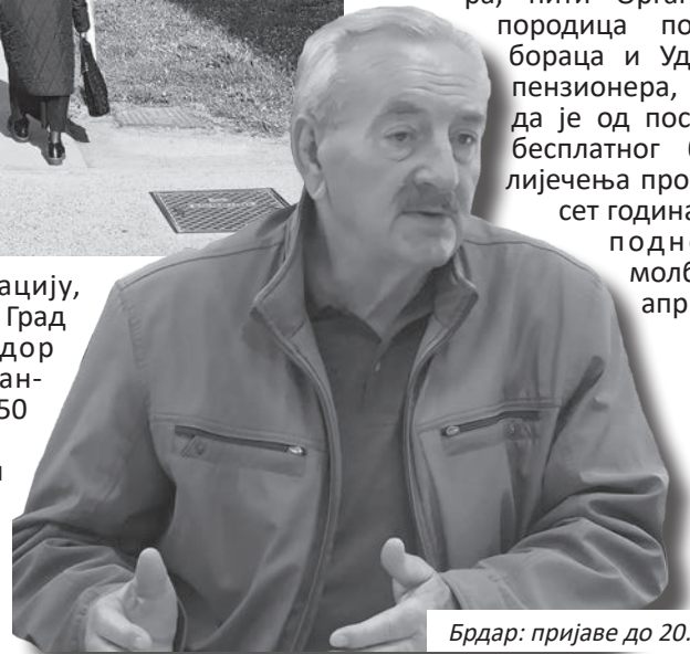
Брдар: пријаве до 20. априла

На актуелни јавни позив по програму Владе Републике Српске, пријавити се могу пензионери који досад никако нису користили бесплатну бањску рехабилитацију, ни о трошку Фонда здравственог осигурања, Борачке организације града Приједора, нити Организације породица погинулих бораца и Удружења пензионера, или да је од посљедњег бесплатног бањског лијечења прошло десет година. Рок за подношење молби је 20. април.