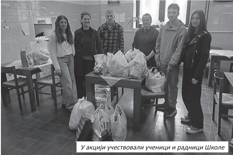
У акцији учествовали ученици и радници Школе