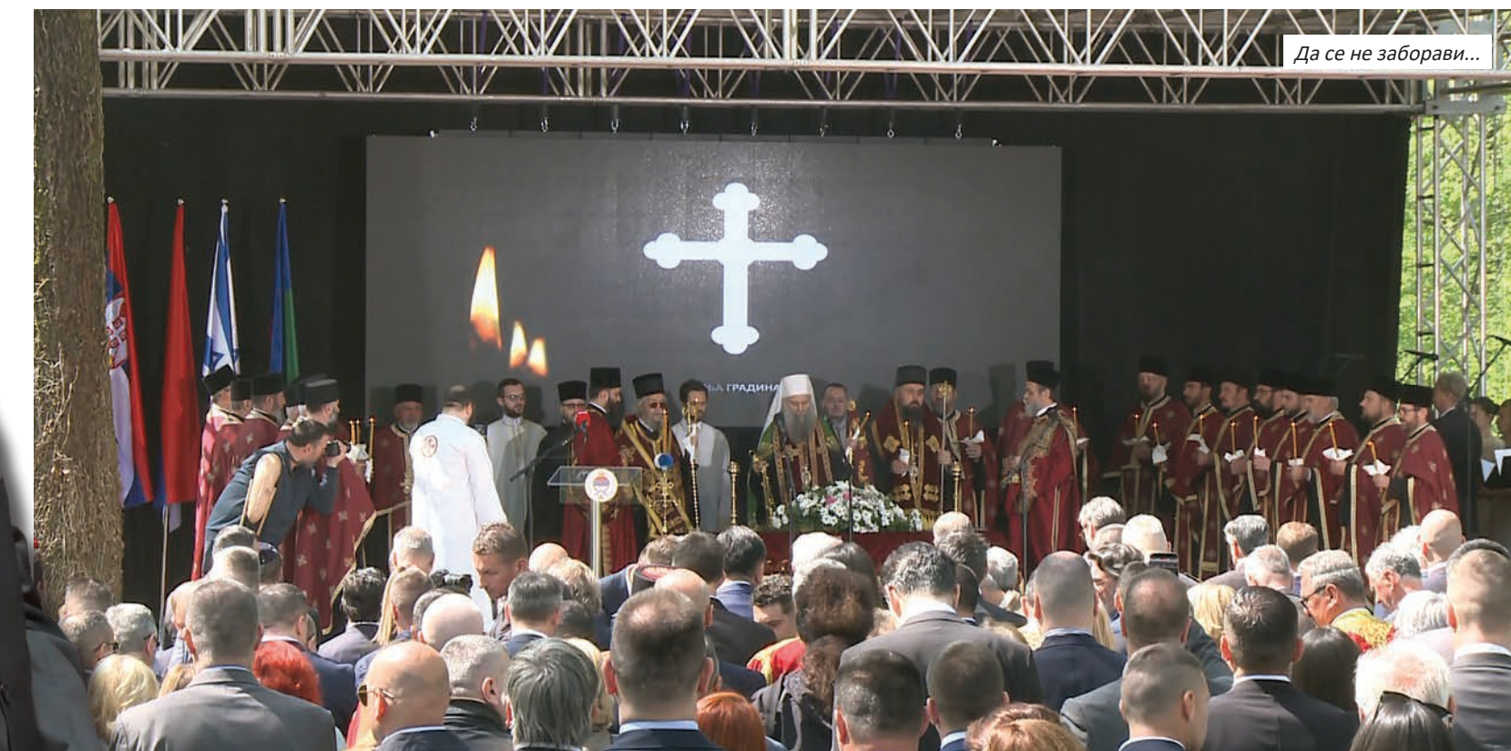
Да се не заборави...

лабухов, представници институција на нивоу БиХ, политичких партија, народни посланици и бројне друге делегације.