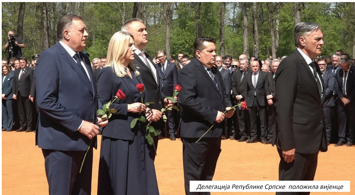
Делегација Републике Српске положила вијенце

То је одговорност свих нас и дужност цијелог свијета“, истакао је Ка-