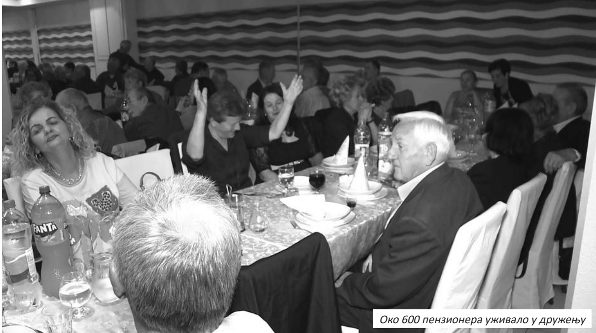
Око 600 пензионера уживало у дружењу