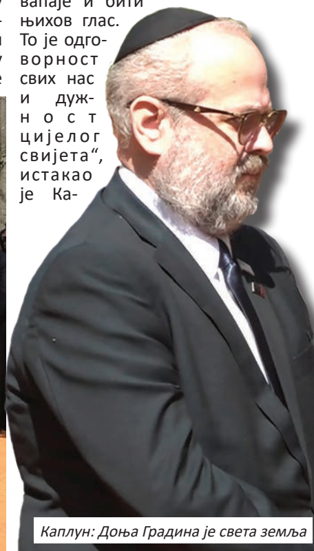
Каплун: Доња Градина је света земља