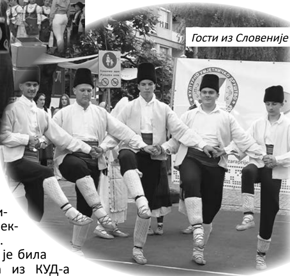
Гости из Словеније

– Прије тога били смо огранак једног старијег друштва. Бавимо се фолклором, пјевањем и ручним радовима. Велика нам је част што смо имали прилику да се представимо приједорској публици – истакла је она.