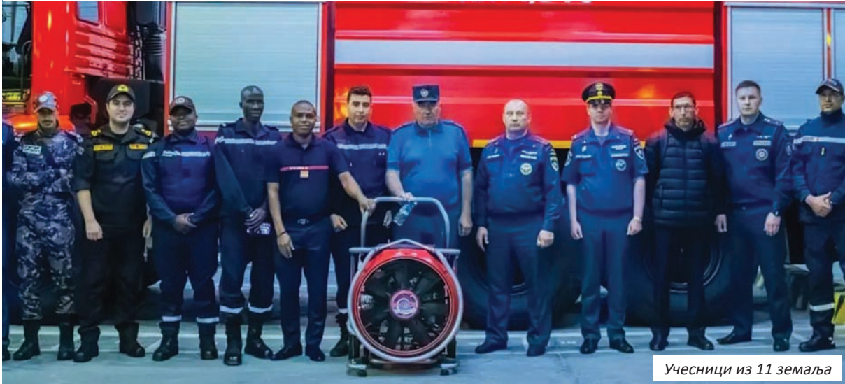
Учесници из 11 земаља