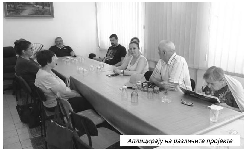
Аплицирају на различите пројекте