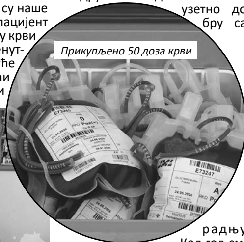
Прикупљено 50 доза крви

„Актив постоји већ 15 година и ово је 46. редовна акција даривања крви. Откад постојимо, прикупили смо 2.000 доза крви. Овај Актив се одазива и на позив Завода за трансфузију Приједора, као и Бања Луке. И с једним и с другим заводом имамо изузетно добру са-