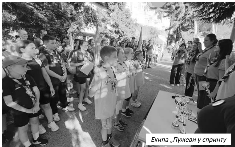
Екипа „Пужеви у спринту“

водницима који екипе воде, уче и бодре на сваком кораку, као