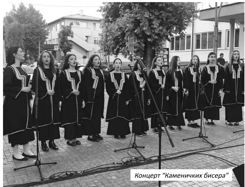
Концерт “Каменичких бисера”

“Ово није први пут да су дјеца из Велике Хоче, Ораховца, Косова Поља, овдје заједно са својим наставницима. Ту су се већ развила дугогодишња пријатељства и посебно ми је драго што и кроз