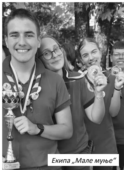
Екипа „Мале муње“

година извиђачке традиције. Из одреда „Др. Младен Стојановић“ захвалили су се организаторима на гостопримству, организацији и дружењу, те че-