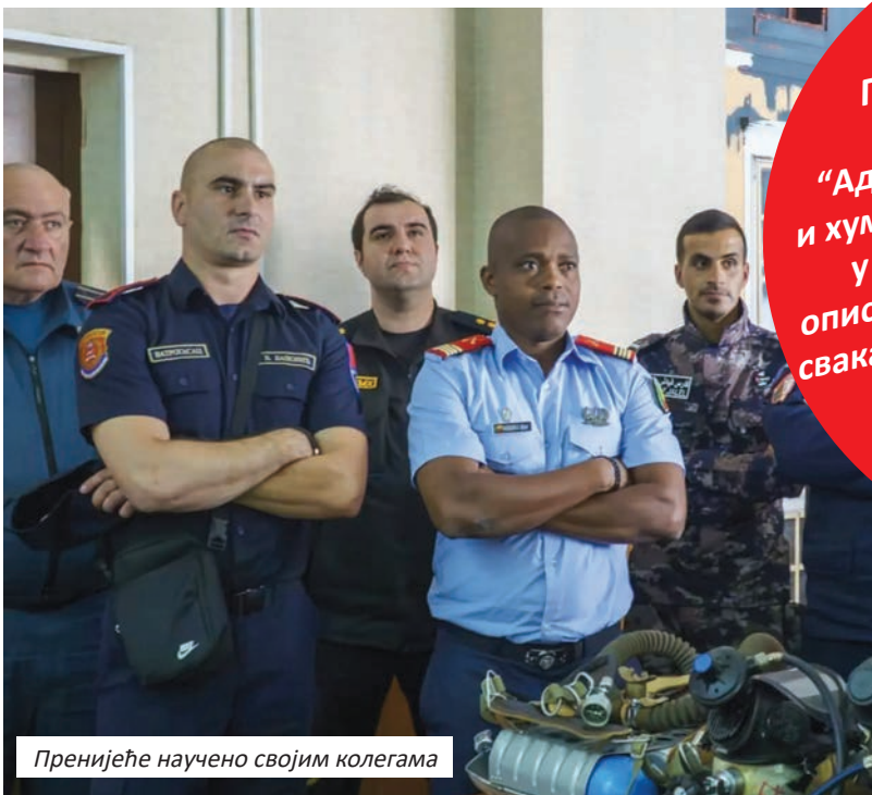
Пренијеће научено својим колегама

Наводи да прате трендове развоја ватрогасне опреме и технике те да стручно усавршавање увијек добро дође. Обука је одржана на Санктпетербуршком универзитету Државне ватрогасне службе за ванредне ситуације Русије, под покровитељством Међународне организације цивилне одбране (ИЦДО).