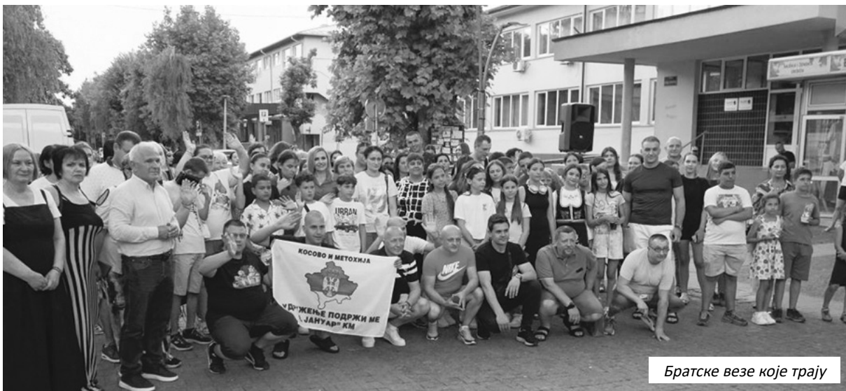
Братске везе које трају

Седмодневни боравак дјеце с Косова и Метохије у Републици Српској трајаће до 26. јуна.