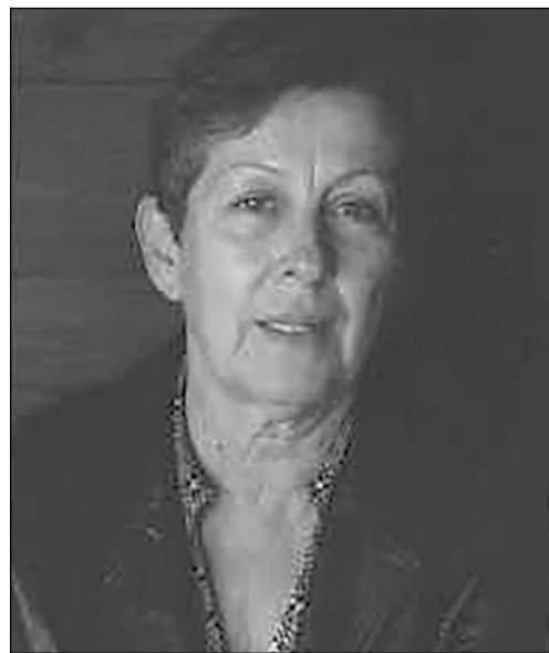
ТАНКОСОВИ – КОСИ АЛЕКСИЋ

У суботу 27.06.2026. у 9 сати на гробљу Горњи Јеловац дајемо четрдесетодневни помен нашој драгој